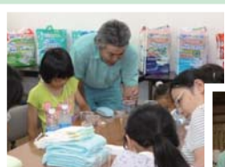
開発部員による 工場内部説明

皆様の心温まるご協力で深く感謝致しますとともに、被災されました皆様の一日も早い復旧を心よりお祈り申し上げます。