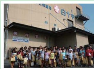
工場前にて参加者全員で記念撮影

7月30日(月)、白十字の本社がある豊島区の小学4・5年生を対象に豊島区親子工場見学会が開催されました。 酷暑の中ではありましたが、群馬工場の見学会に親子20組が参加されました。